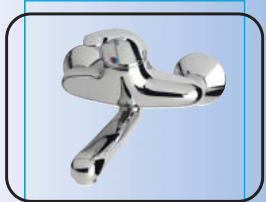
Fali mosdó csaptelep, fém automata leeresztővel B2080AA