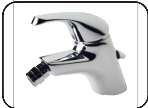
Álló bidet csaptelep, fém automata leeresztővel, flexibilis bekötőcsővel B2071AA