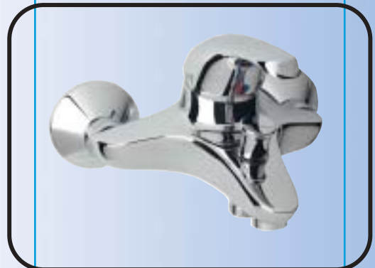
Fali kád/zuhany csaptelep kiegészítők nélkül, automata zuhanyváltóval B2073AA