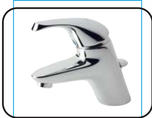
Álló mosdó csaptelep, fém automata leeresztővel, flexibilis bekötőcsővel B2067AA