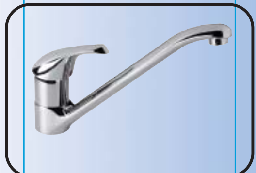
Álló mosogató csaptelep, flexibilis bekötőcsővel B2069AA