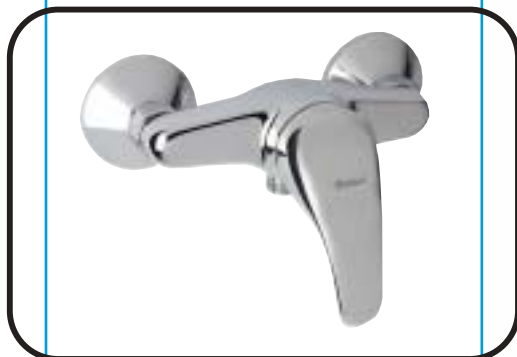
Fali zuhanycsaptelep kiegészítők nélkül B2079AA